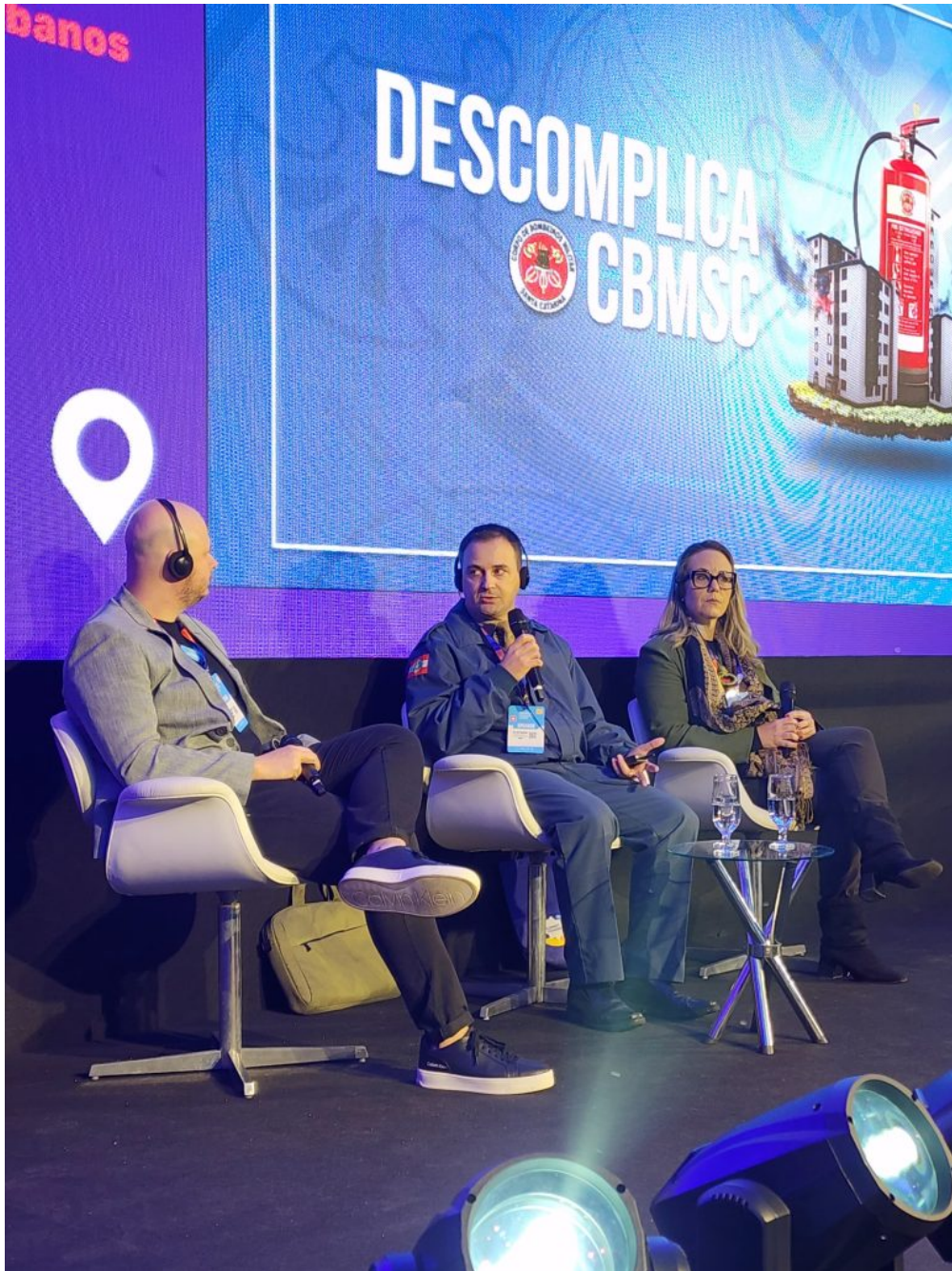
Cel BM Fazzioni Diretor da DSC do CBMSC, explanando sobre o Descomplica SC