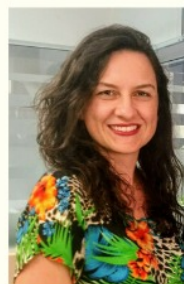
Mestre em Engenharia Ambiental Conselheira do CREA/SC Presidente da AEFVALE

Dia 17 de junho - 20h00 Duração: 1h30 Plataforma Microsoft Teams Inscrições pelo -mail: ceef@furb.br