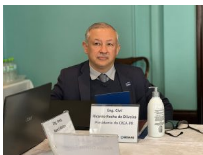
Presidente do Crea-PR,