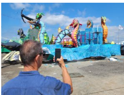
Passarela do Samba Negro