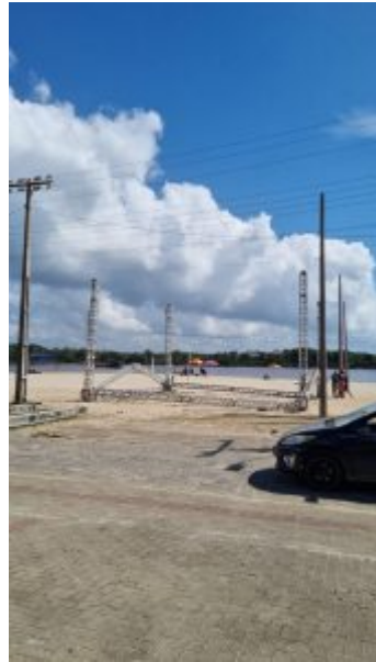
Balneário Barra do Sul