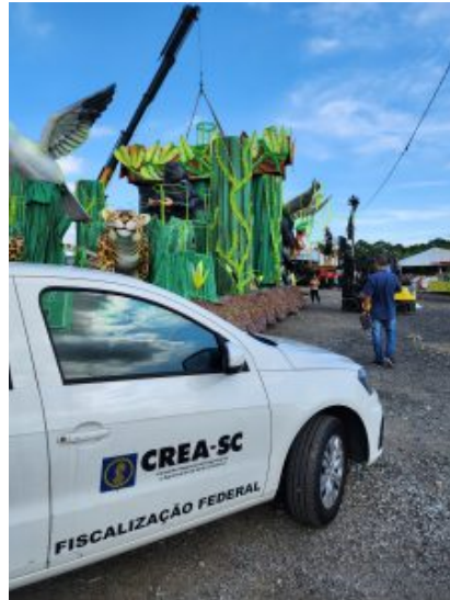
Passarela do Samba Negro Quirido