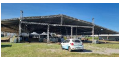
Mar Grosso, Laguna