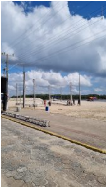
Balneário Barra do Sul