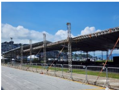
Passarela do Samba Negro Quirido