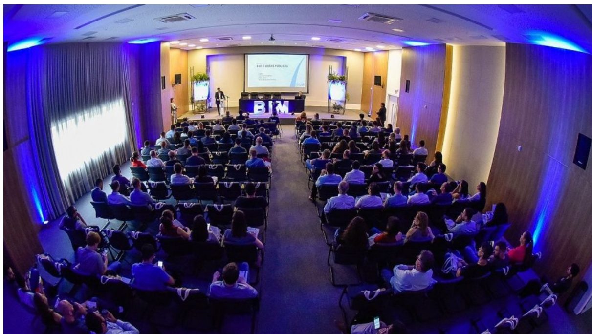
Florianópolis, SC, Square Corporate, Evento: BIM, A Hora

O Conexão BIM está entre as iniciativas com patrocínio do CREA-SC e tem conectado profissionais com objetivos e interesses comuns dentro e fora do país, possibilitando o intercâmbio de informações, experiências, negócios, networking e parcerias, abrindo portas para o mercado internacional.