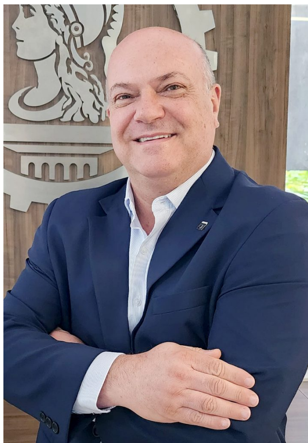
Presidente do CREA-SC, Eng.

O programa viabiliza a participação dos estudantes em ações de incentivo ao exercício profissional responsável, promovendo seu desenvolvimento pessoal e corporativo. Um dos benefícios é o acesso gratuito à “ART Jr” (Anotação de Responsabilidade Técnica), um documento que simula o preenchimento de uma ART Profissional e funciona como um treinamento. Em Santa Catarina já foram geradas 5.492 ARTs Jr.