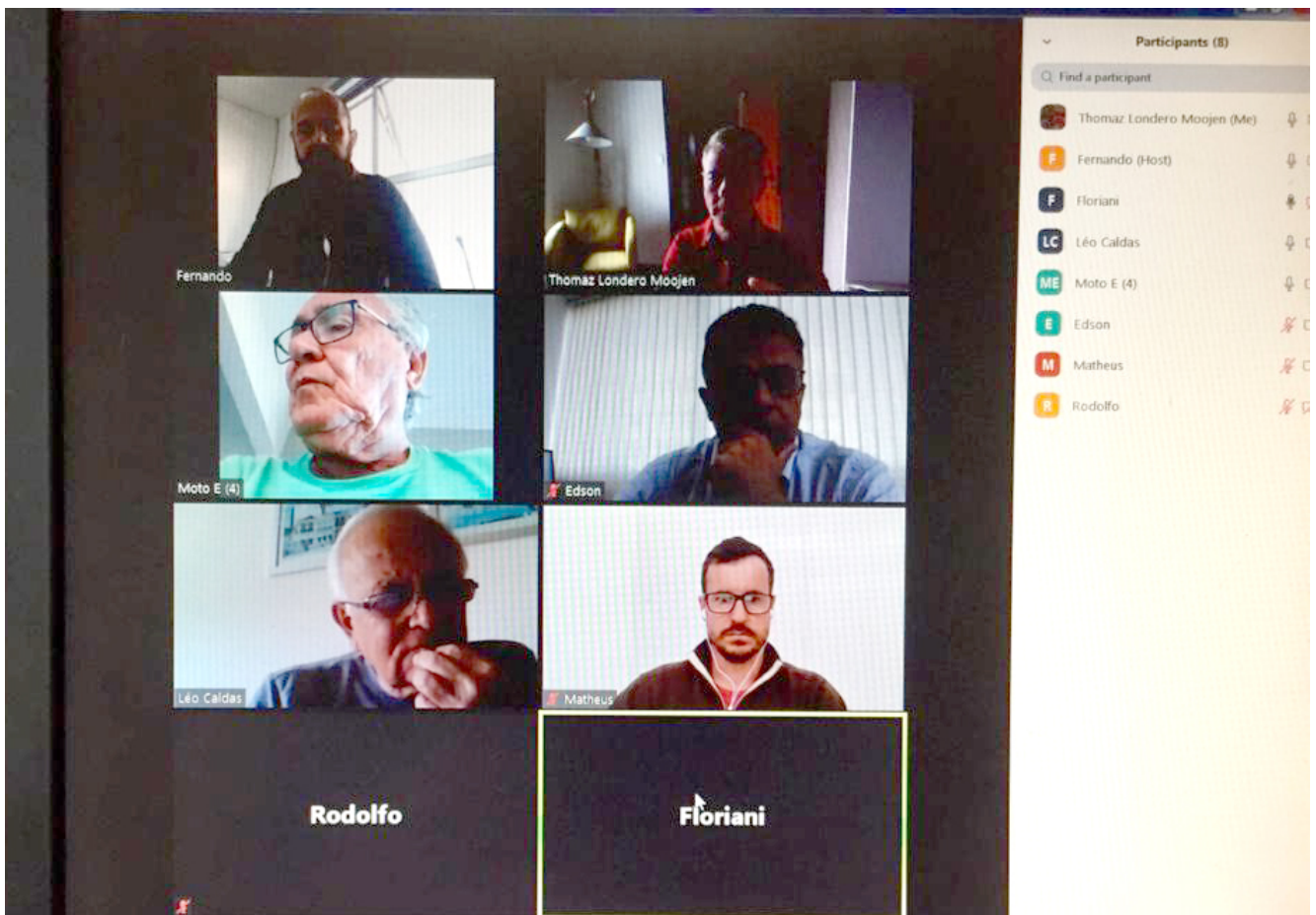
Comissão de Renovação do Terço