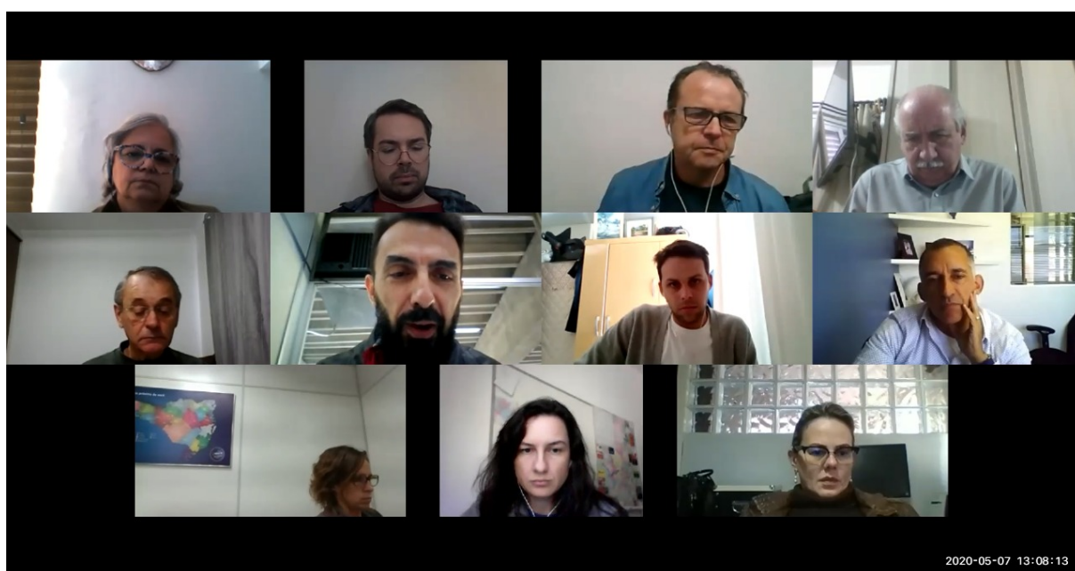
Comissão de Ética

O CREA realizou esta semana todas as reuniões em formato de videoconferência. A de Coordenadores de Câmaras dia 5.05, Coordenadores de Comissões dia 6, e hoje durante a manhã e tarde as reuniões das Câmaras Especializadas.